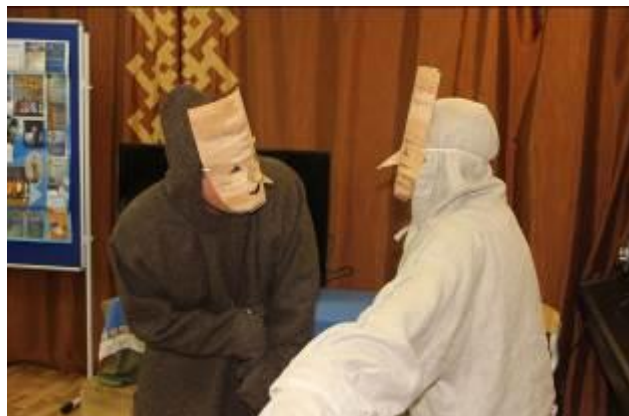
Сценка из медвежьих игрищ «Хитрый рыбак».