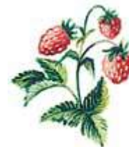
княжника - ся̄нси морах