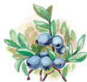
голубика – т̄ахтпил