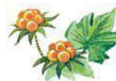
морошка – морах