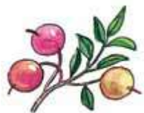
клюква – са̄нқвл̄ьпил