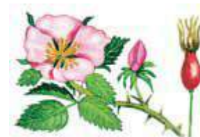
шиповник - йныг