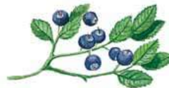
черника – с̄авни пил