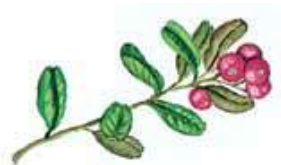
брусника – сўйпил