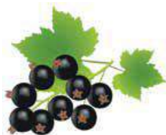
смородина – сосыг