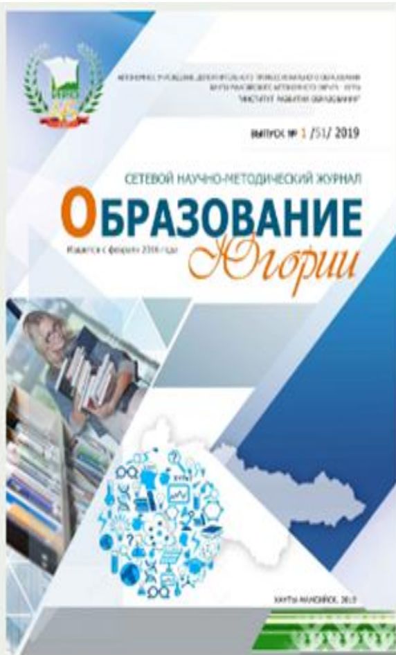
Образование Югории: Сетевой научно-методический журнал. Выпуск № 1/51/2019