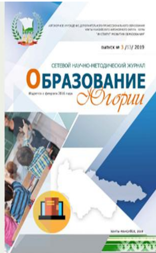
Образование Югории: Сетевой научно-методический журнал Выпуск № 3/53/2019