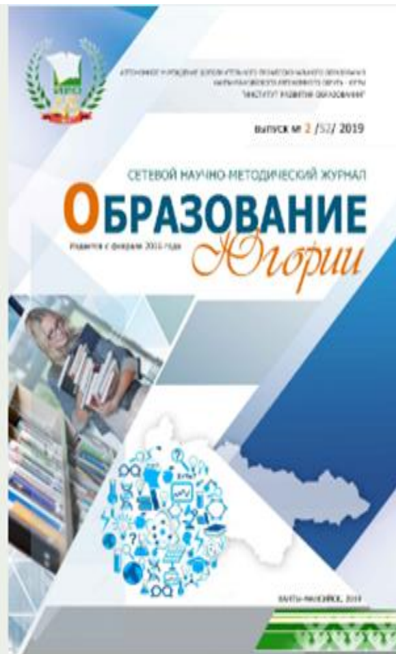
Образование Югории: Сетевой научно-методический журнал. Выпуск № 2/52/2019