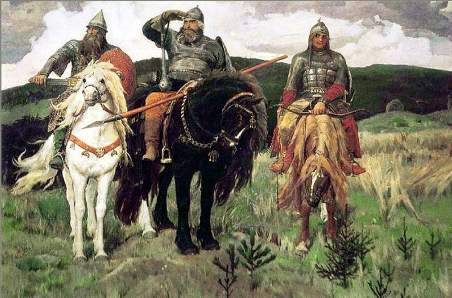
Алеша Попович, Илья Муромец, Добрыня Никитич.