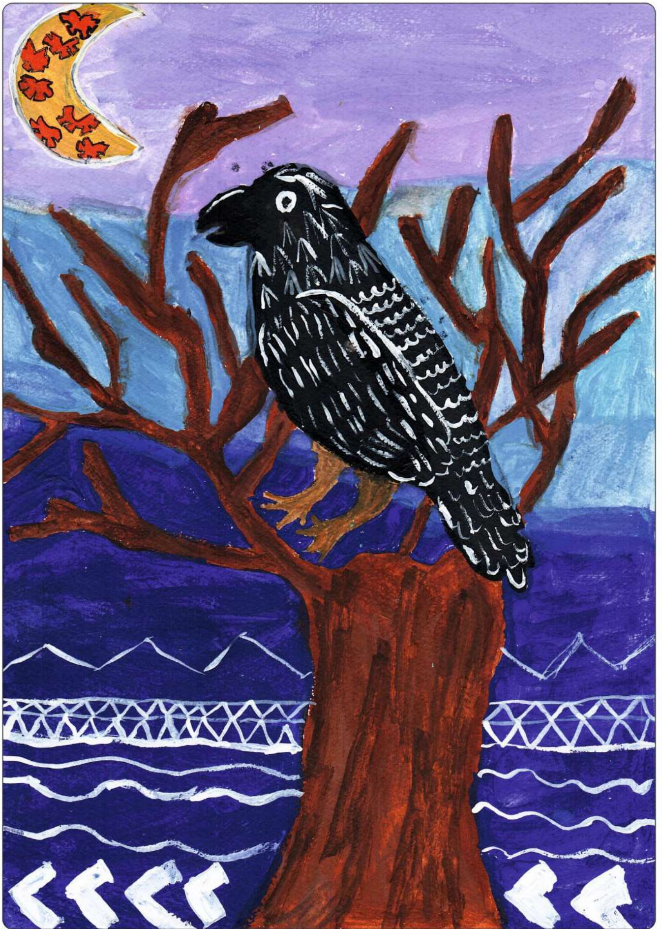
автор: Баканова Вероника, 10 лет