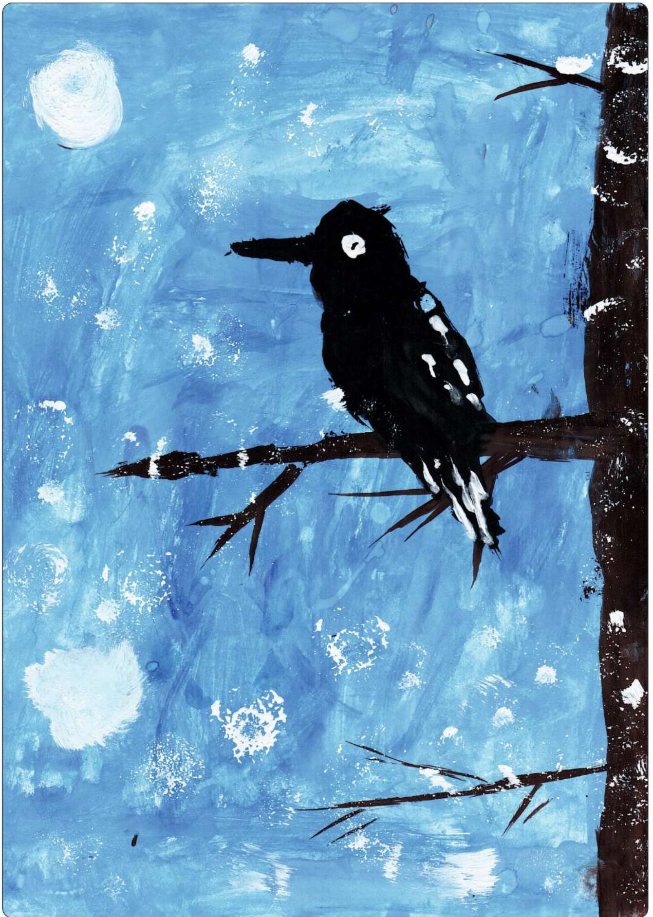
автор: Пузанова Полина, 7 лет