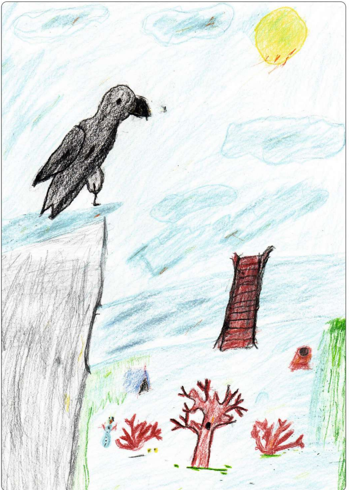
автор: Желтков Андрей, 11 лет