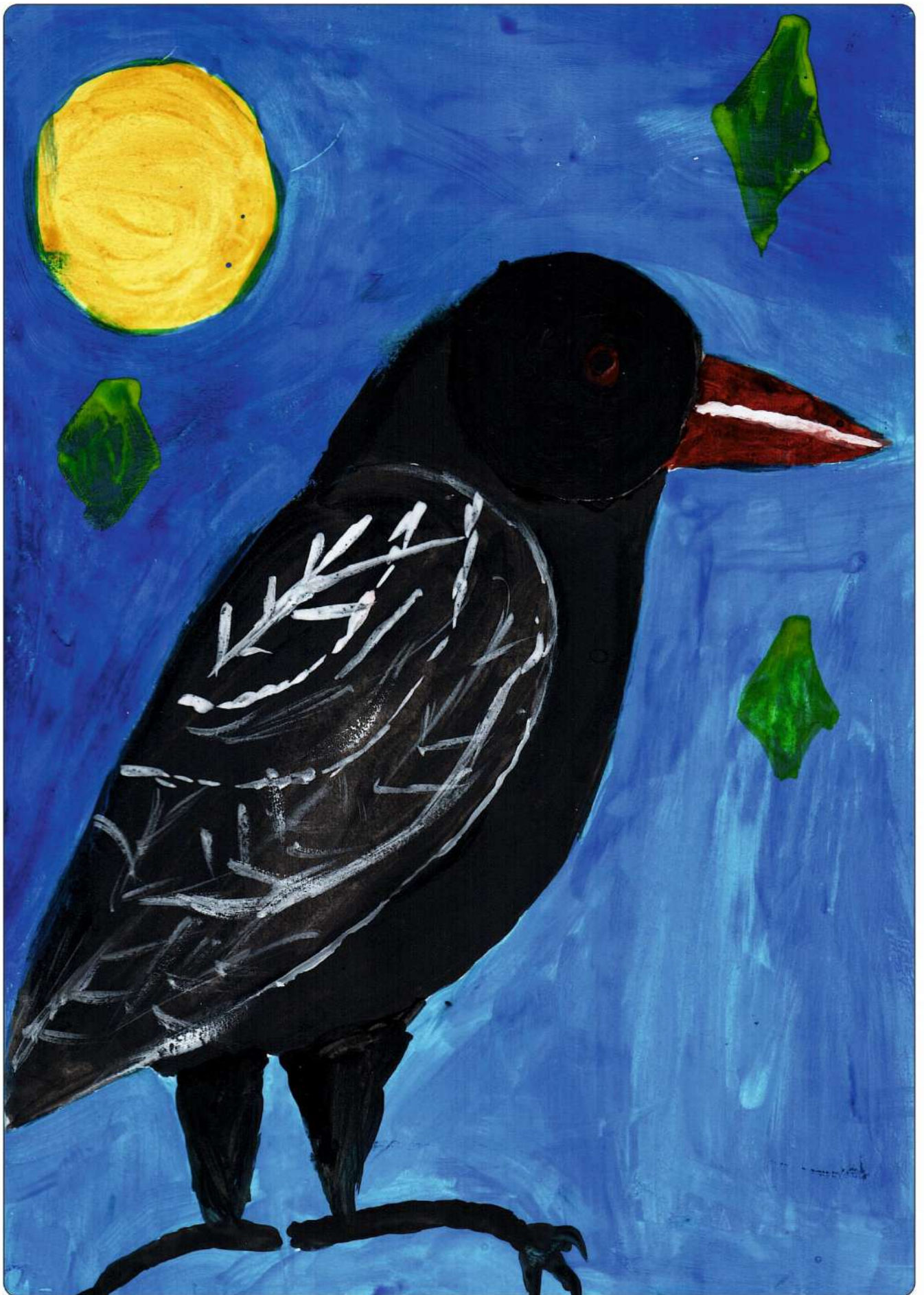
автор: Алишунина Варвара, 9 лет