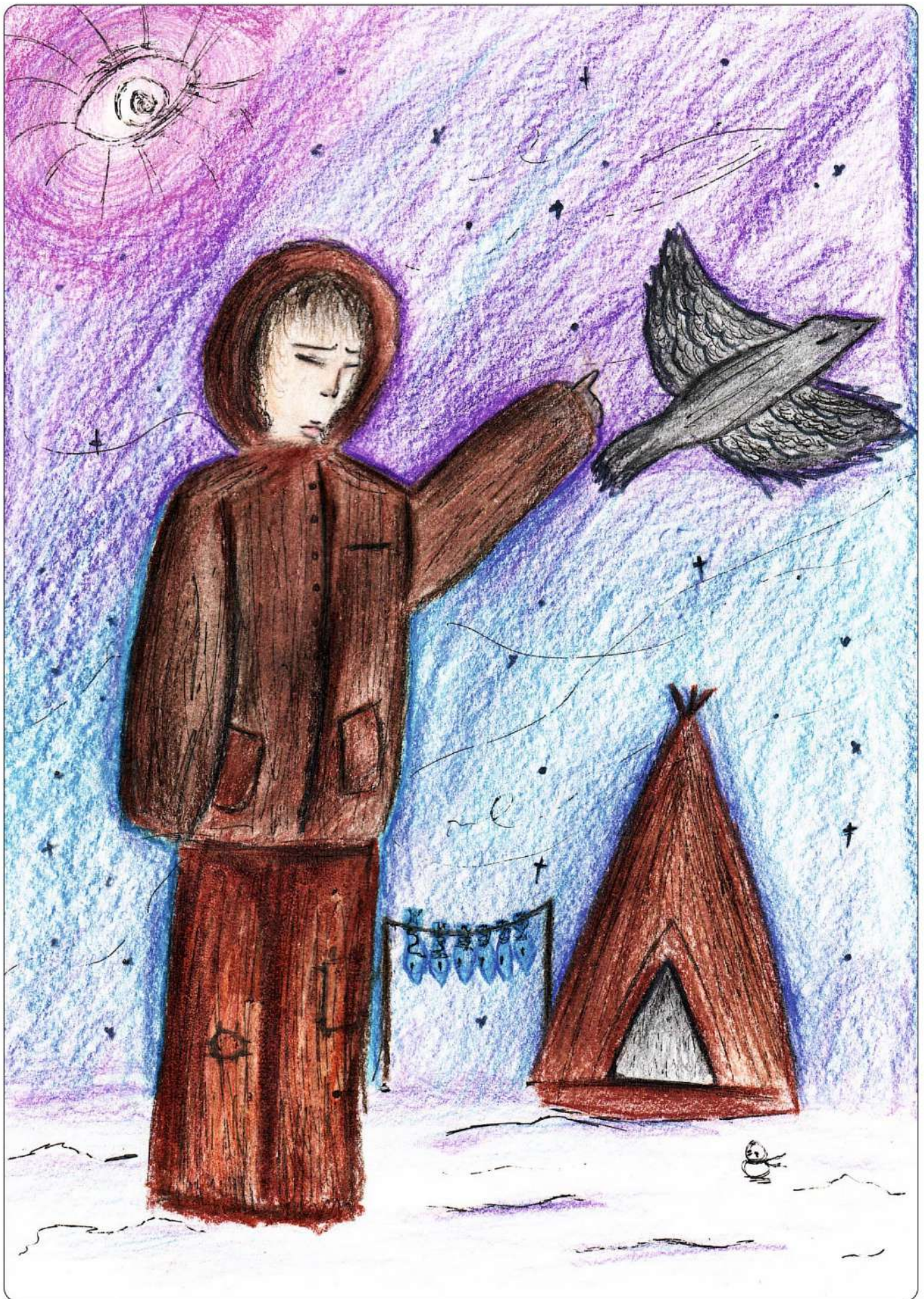
автор: Кривцова Софья, 12 лет