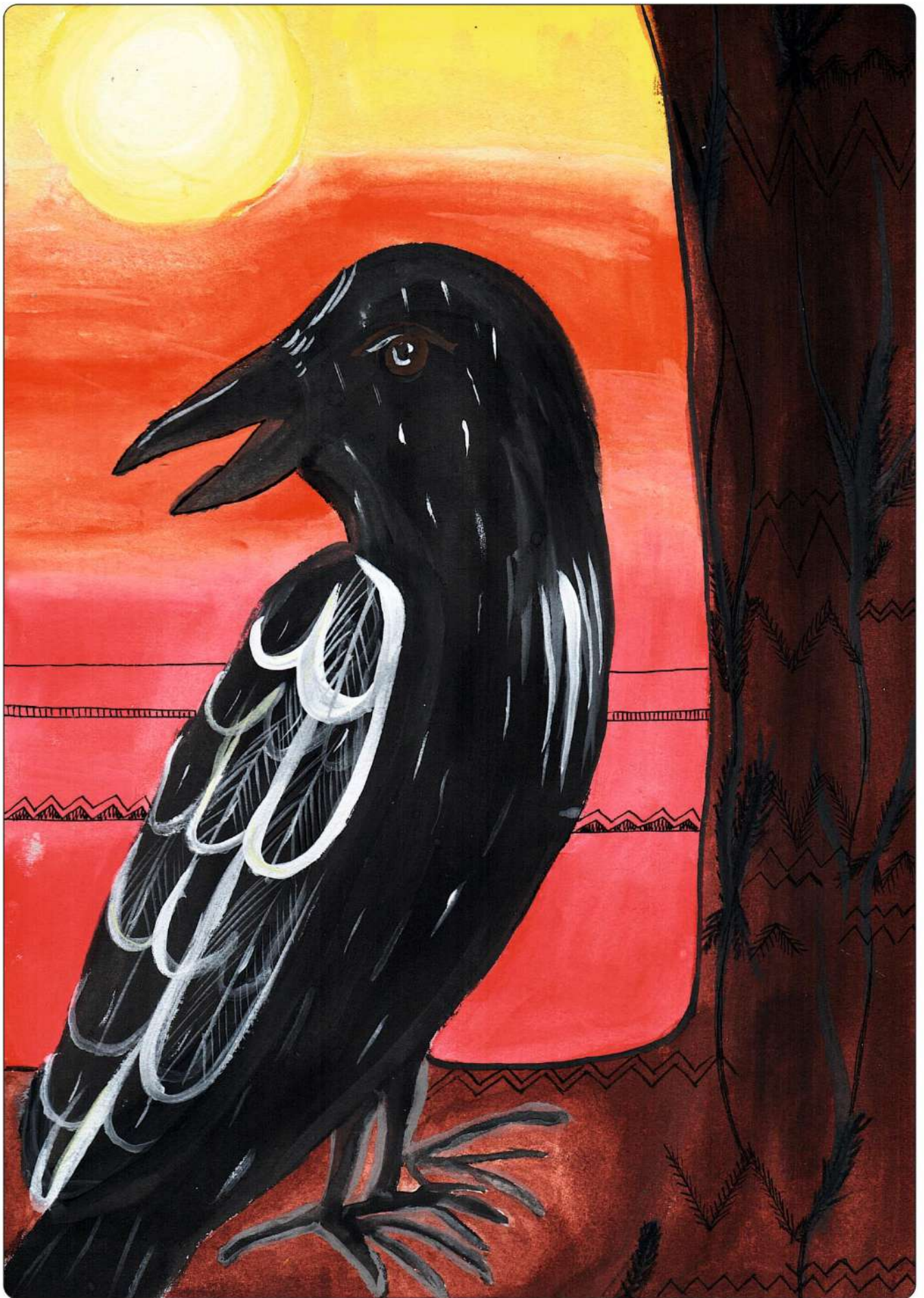
автор: Васильева София, 10 лет